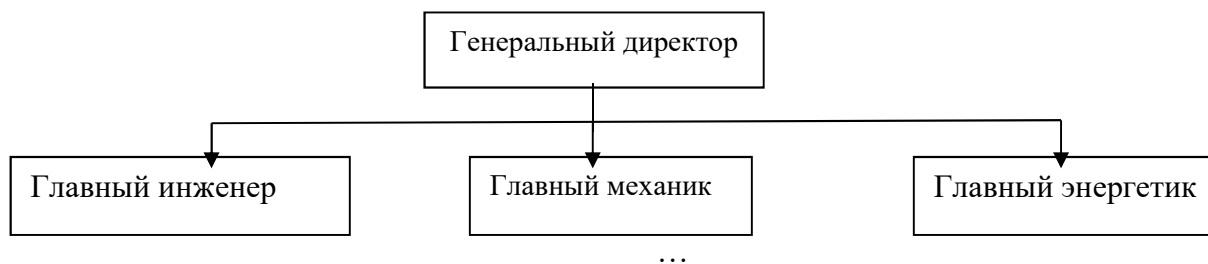
Рисунок 1 – Структура администрации организации

Рисунки, за исключением рисунков в приложениях, следует нумеровать арабскими цифрами сквозной нумерацией по всей работе. Каждый рисунок (схема, график, диаграмма) обозначается словом «Рисунок», должен иметь заголовок и подписываться следующим образом – посередине строки без абзацного отступа, например: